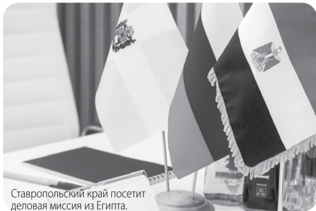
Ставропольский край посетит деловая миссия из Египта.

Республика Египет – один из перспективных зарубежных партнёров Ставрополья, с которым край развивает торгово-экономическое сотрудничество.